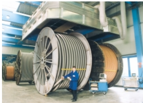
Qualitäts-, Verfahrens-, Druck- und Materialprüfungen im Rahmen der Systemzulassung durch externe Überwachungsorganisationen und der internen Qualitätssicherung