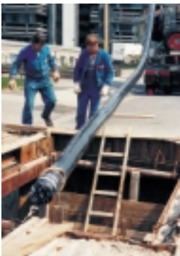
Verlegung einer doppelwandigen Rohrleitung vom Typ FLEXWELL-Sicherheitsrohr®